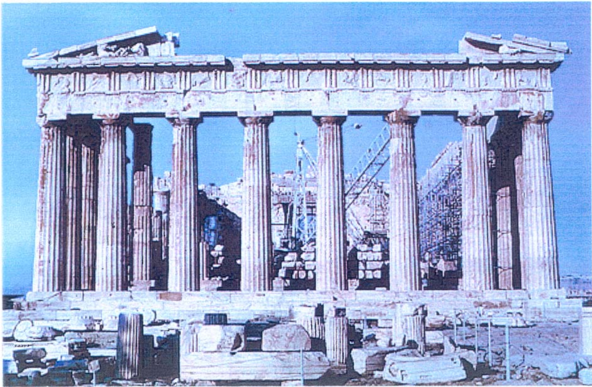
Η ανατολική όψη του Παρθενώνα μετά την αποκατάστασή της